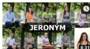
Nominace Jeroným a Jeronýmek 2019 jergymtv • 416 zhlédnutí • před 1 týdnem

Chcete-li se o nominantech dozvědět trochu více, podívejte se na krátké video od JergymTV.