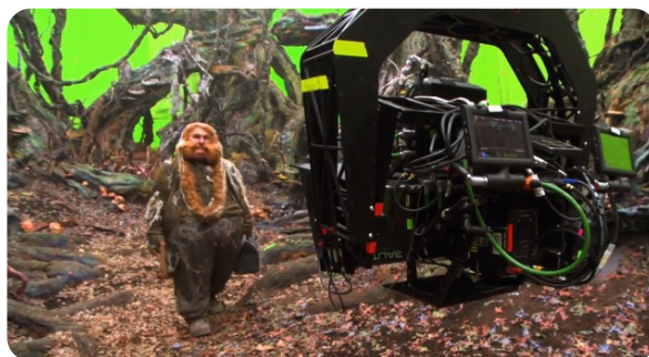
Fotografie z natáčení Hobita

extrémně nesympatický od začátku až do konce. Asi