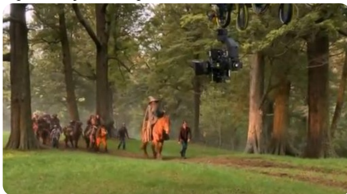
Fotografie z natáčení Hobita

trochu jako domácí kino, pro zábavu. To je charakteristika knihy a už kvůli takové předloze nemohl vzniknout v rukou filmařů žádný hrdinský fantasy epos podobný Pánu Prstenů . Peter Jackson si byl této slabiny předlohy vědom a tak se to rozhodl „napravit“ a do filmu si přidal zápletku, o které není v knize ani zmínka. Ústřední postavou této zápletky je skřetí vůdce Azog, úhlavní nepřítel vůdce trpaslíků Thorina Pavézy. Ten Thorina nenávidí a výpravu pronásleduje přes celou Středozem, zatímco v knize se hrdinové setkávají na cestě jen s náhodnými překážkami. Zároveň ale Jackson ponechal většinu příhod z knihy v jejich nezměněné podobě a výsledkem byl jakýsi hybrid, kvůli němuž mi přišla zápletky s Azogem umělá a do filmu mi neseseděla. Podle mě tam tenhle přídavek nebyl nutný, ale samozřejmě se najdou tací, kteří by se mnou nesouhlasili. Pokud by jsme v knize chtěli najít nějakou souvislost s osudem Středozemě, bude to nejspíš Gandalfovo odbíhání na schůzi Bílé rady, kde se probírá situace v Dol