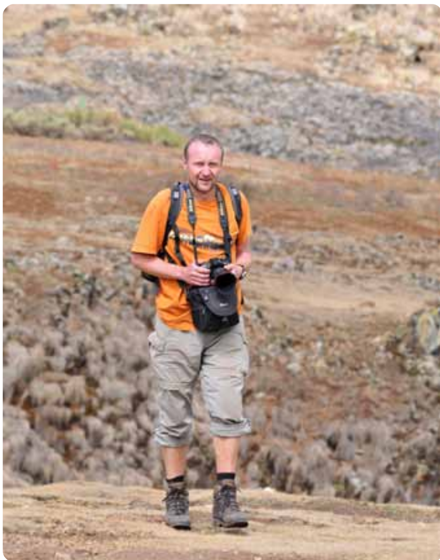
Pan ředitel na túře v Bale Mountains v Etiopii.

A samozřejmě přeji Vám všem příjemné prožití vánočních svátků.